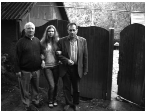
4. Карма — закон вечной причины и следствия

в лучшее завтра, способствует пониманию смысла жизни и смерти, проясняет смысл божественной любви, радости и удовлетворения. И приводит к пониманию стадий духовного развития. Бог Вселенной даёт каждому шанс развития. За нами