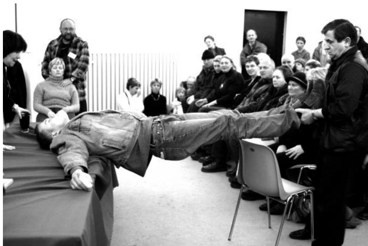
6. Представление эстрадного гипноза

В зависимости от наших мыслей мы поступаем так или иначе. Если посмотрим на себя в зеркало и подумаем о печали или о чем-то плохом, присмотреться к своим морщинам — то увидим, как печаль изменит нас. А когда подумаем о чём-то прекрасном, о радости — то будем выглядеть совершенно иначе — глаза будут излучать радость и свет. Я думаю, что сила мысли служит доминантой, которая, как говорится, может передвигать камни и горы. Сила мысли несёт в себе живую и могучую энергию, которая действует не только на людей, но