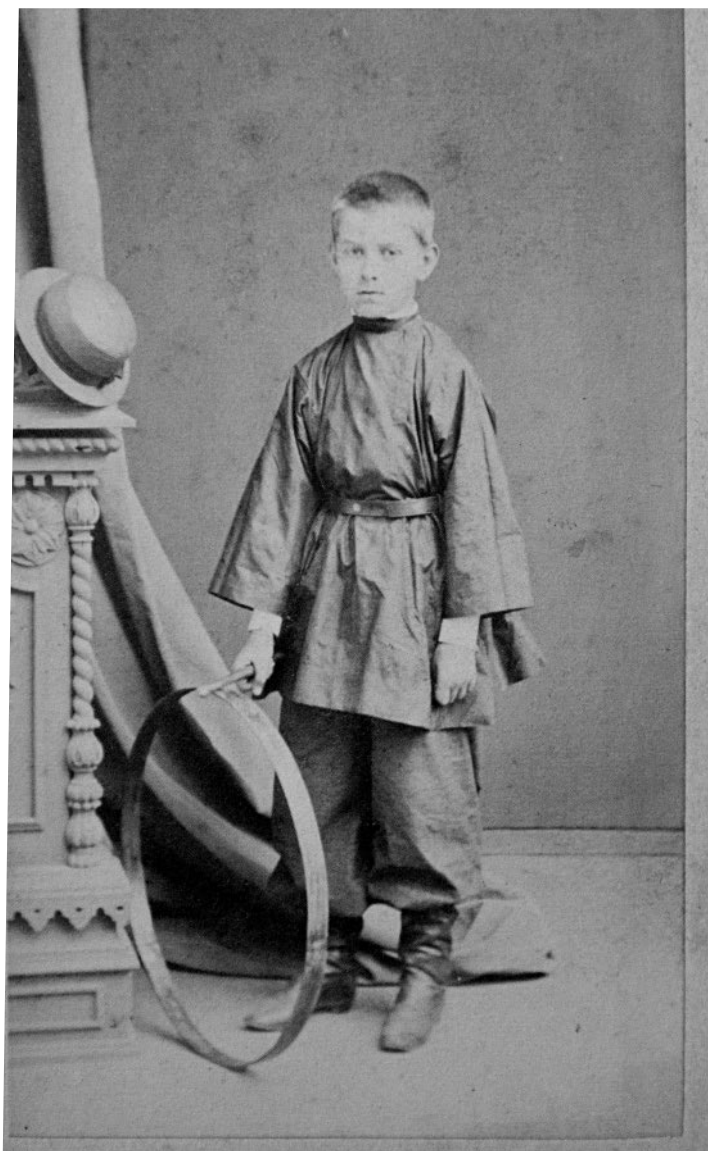
В.П. Сербский в детстве