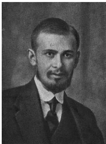
Поливанов Евгений Дмитриевич (1891–1938) — российский лингвист, специалист по многим, преимущественно азиатским языкам. Изучал проблемы, связанные с причинами языковых изменений. Исследовал социальное функционирование языка, разрабатывал принципы языковой политики

Но зачем вообще надо изучать язык, если люди бессознательно овладевают своим языком (реже сразу двумя или тремя языками) в раннем детстве? Как писал замечательный отечественный ученый Евгений Дмитриевич Поливанов (1891–1938), «родной язык выучивается (в основных своих элементах) в том возрасте, для которого не существует декретов и циркуляров». Потом человек